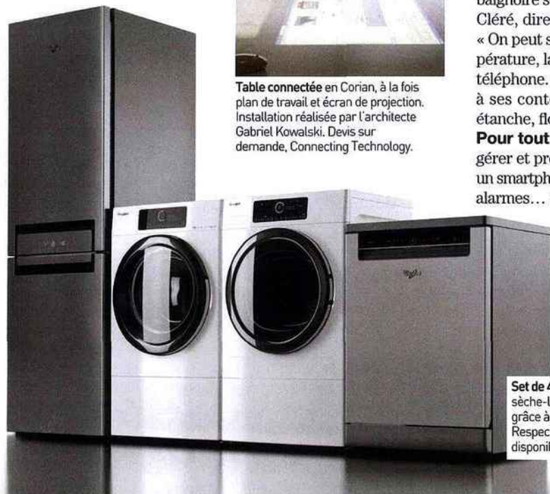
Set de 4 appareils (réfrigérateur, lave-linge, sèche-linge, lave-vaisselle) connectés entre eux grâce à la technologie « 6ème Sens Live ». Respectivement 1400 €, 1300 €, 1200 € et 900 €, disponibles en septembre 2015, Whirlpool.

TELEX Marché porteur. En 2017, la maison connectée va générer un chiffre d'affaires de 300 millions d'euros, contre 150 millions en 2014 (étude de l'institut Xerfi sur « Le marché de la maison connectée »). Parmi les facteurs qui expliquent cette prévision, citons l'amélioration de la conjoncture dans le bâtiment, ainsi que les besoins croissants des Français en matière de confort, sécurité et réduction de leur facture énergétique.