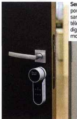
Serrure connectée « ENTR » pour porte d'appartement. Verrouillage sans clé, mais avec smartphone, télécommande, lecteur d'empreinte digitale ou code. Gamme « Revo' motion », prix sur demande, Vachette.