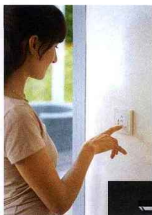
Interface « TaHoma » pour piloter plus de 100 équipements (stores, portails, lumières, chauffage, alarmes...). Disponible avec la TaHoma Box. Devis sur demande, Somfy.