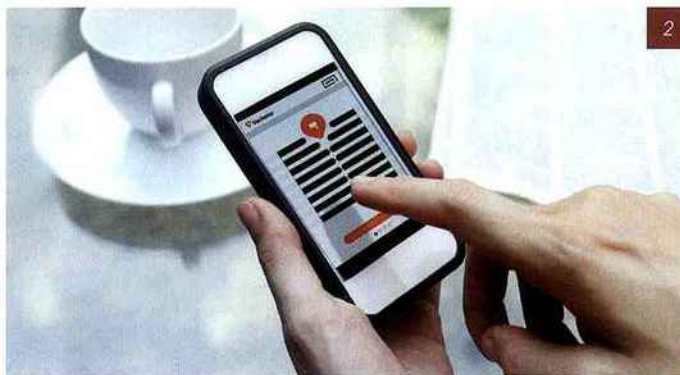
2 - Ouverture de la serrure connectée Revo'Motion de Vachette par smartphone.