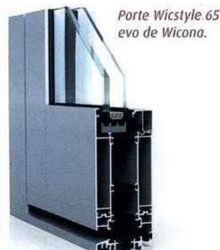
Porte Wicstyle 65 evo de Wicona.