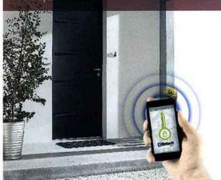
Zilten adopte la serrure intelligente et connectée Okidokeys.

Le téléphone devient la clé des portes Zilten avec Okidokeys, grâce au pack exclusif vendu avec la porte ou en fourniture seule. Il contient 1 serrure connectée, 1 lecteur sans fil et 3 pass d'accès - 1 bracelet, 1 carte et 1 badge. Zilten mise par ailleurs sur la déco intérieure pour ses portes mixte bois/alu à haute isolation thermique Ud à partir de 0.97 et acoustique Ra;tr jusqu'à 35 dB : il enrichit ses finitions Movingui, Chêne naturel ou ton Wengé de 3 nouvelles teintes inspirées de