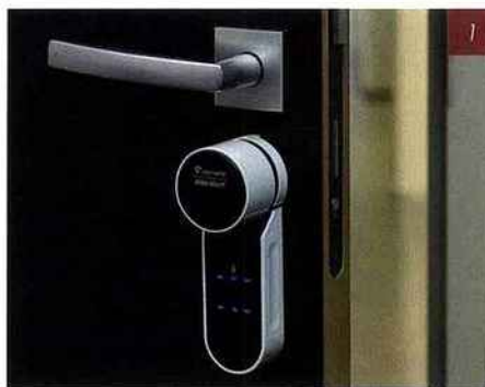
1 - Nouvelle serrure connectée ENTR pour portes d'appartement. Revo'Motion de Vachette.

Vachette enrichit sa gamme Revo'Motion d'une nouvelle serrure connectée ENTR pour portes d'appartement. Désormais, il est possible de rentrer et sortir de chez soi sans clé et en toute sécurité grâce à smartphone, télécommande, lecteur d'empreinte digitale ou code (ces 2 derniers modes disponibles en option, avec installation d'un boîtier mural additionnel). Vachette a développé la nouvelle application ENTR, compatible smartphone iOS ou Android, qui permet d'ouvrir sa porte ou de partager avec des tiers une autorisation d'accès au domicile. Cette nouvelle serrure connectée intègre un cylindre VIP+ breveté Vachette (clé non recopiable) et utilise un protocole crypté sécurisé de type Bluetooth Low Energy, indépendant du réseau cellulaire. La porte se verrouille automatiquement après fermeture grâce à la motorisation puissante du cylindre motorisé. L'installation réalisée sans perçage ni câblage ne nécessite aucune modification de la porte ni de la serrure. Le montage rapide s'effectue à la place du cylindre mécanique traditionnel de type européen. Sa compatibilité est assurée avec la grande majorité des portes et serrures françaises. La gamme Revo'Motion de Vachette propose ainsi une poignée électronique pour porte d'entrée de maison, un verrou électronique pour sécuriser l'accès d'une porte secondaire et la nouvelle serrure connectée ENTR pour porte d'entrée d'appartement. ■■