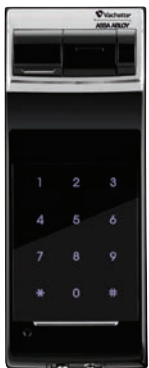
Boîtier externe RL 1120