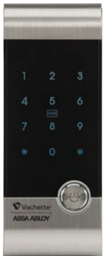
Boîtier externe RL 1120