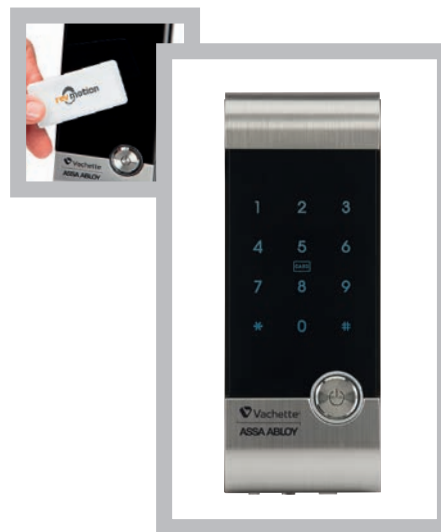
Verrou Revo'Motion RL1120. Ouverture par badge ou code.