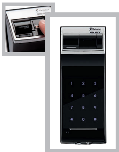
Verrou Revo'Motion RL1420. Ouverture par empreinte digitale et/ou code.